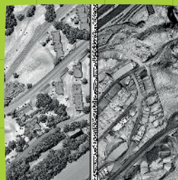
MNT ET MNE