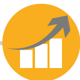
QUALITÉ DE SERVICE