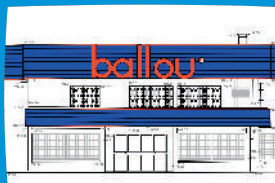
RELEVÉ : INTÉRIEUR / FAÇADES