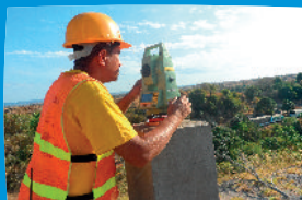
SUIVI ET MONITORING CHANTIER